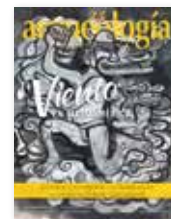
Portada: Germán Venegas, Ehécattl , 2018.

REVISTA BIMESTRAL Julio-agosto de 2018, vol. XXV, núm. 152