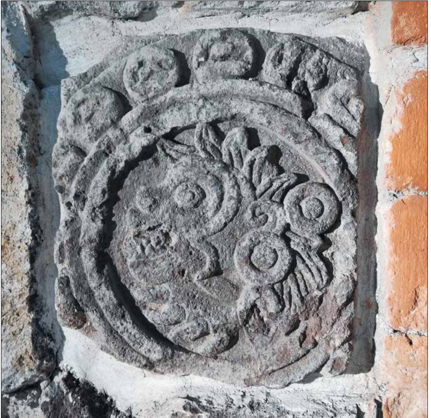
Losa con el glifo calendárico 1 mono de la tienda de Bershka situada en Motolinía 22.