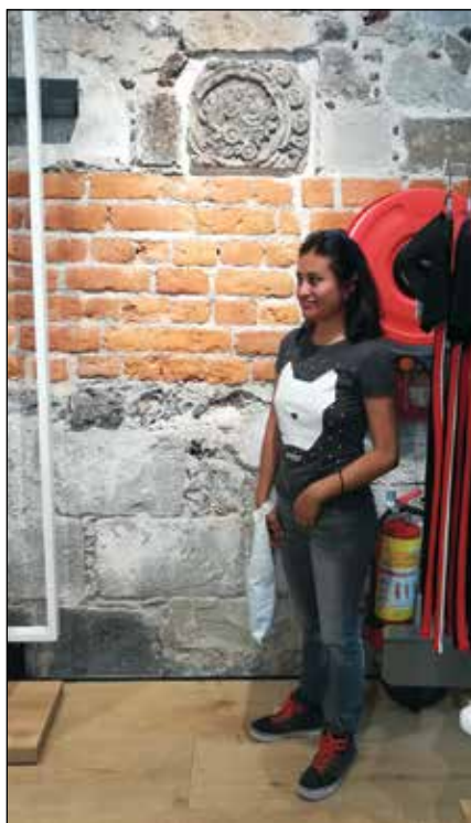
Ubicación del relieve descubierto en el muro oriental de la recién renovada tienda de Bershka.