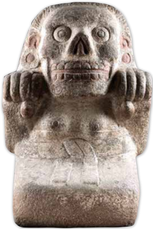
Escultura de una cihuatéotl del día 1 mono hallada en la Casa Boker. Museo Nacional de Antropología.