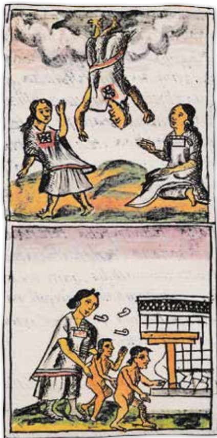
Una cihuatéotl descende del cielo en el día 1 águila y una madre protege a sus hijos encerrándolos en casa. Códice Florentino , lib. IV, cap. XXXIII, f. 62r.

co días funestos, señalados por el descenso de las deidades celestiales conocidas como cihuateteo (“divinidades femeninas”). Eran éstas las mujeres que habían fallecido en su primer parto, elegidas por la diosa madre para que compusieran el ejército de servidoras que auxiliaban al Sol en su curso cotidiano. Así, las cihuateteo recibían al astro en el cenit, lo cargaban en sus andas con rumbo al occidente y lo conducían por el bosque rojo hasta entregarlo a la muerte en el punto de su ocaso. Talejército estaba dividido en cinco grupos que visitaban regularmente la tierra, uno a uno, cada 52 días. Las fechas de su temida bajada desde el cielo eran 1 venado, 1 lluvia, 1 mono, 1 casa y 1 águila, cuando llegaban a las encrucijadas de calles y caminos para enfermar a transeúntes y viandantes. Buscaban