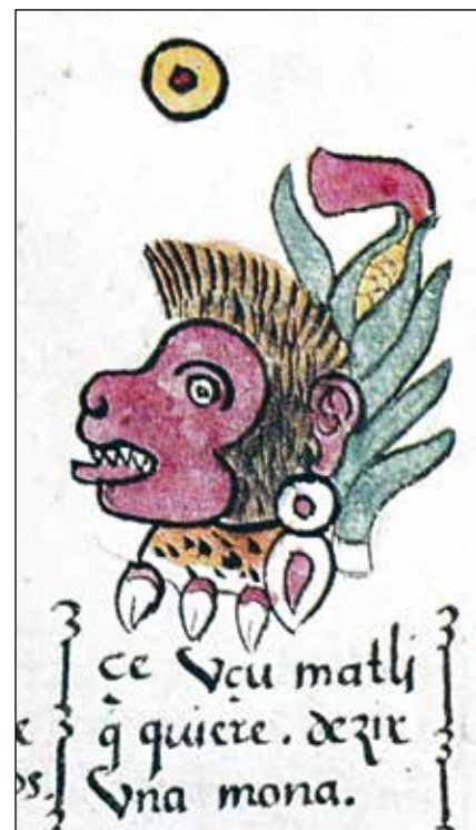
Glifo calendárico 1 mono de la lámina 14v del Códice Magliabechiano .

No obstante, la fecha 1 mono también formaba parte de un grupo de cin-